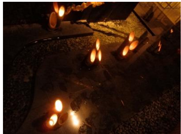
千草ホテルの中庭 点灯式の様子